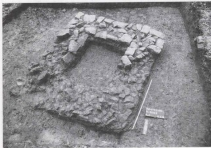
Abb. 119 Hechingen-Stein. Tempelbezirk. Kapelle 127.

Entsprechend den Beobachtungen 1993 sind auch diese gleichartig in Ausrichtung und Größe. Allem Anschein nach bilden sie Gruppen von bis zu drei Stück, die Kapellen 116 und 120 sind aneinandergebaut. Kapelle 127 (Abb. 119) steht zum gegenwärtigen Zeitpunkt noch isoliert da, der umgebende Bereich ist allerdings noch nicht untersucht. Diese gruppenweise Ausrichtung und die Befunde lassen vermuten, daß die Kapellen nach einer bestimmten Ordnung geplant und erbaut wurden. So sitzt z. B. Kapelle 99 teilweise auf der abgetragenen Mauer 24 auf und wurde dem hier sehr