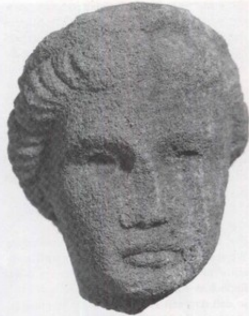
Abb. 120 Hechingen-Stein. Tempelbezirk. Kopf einer lebensgroßen Junostatue.

Zusätzlich konnten, wie in den vorangegangenen Jahren, auch 1994 wieder zahlreiche Teile fragmentierter Sandsteinskulpturen freigelegt werden. Bei dem Oberkörper eines Mannes dürfte es sich um den Giganten einer Jupitergigantensäule handeln. Damit würde sich die Anzahl dieses Denkmaltyps in Hechingen-Stein auf zwei erhöhen, da bereits im vorangegangenen Jahr das Fragment eines anderen Giganten gefunden wurde. Bei einem nackten Torso, der von der Brust bis zu den Knien erhalten geblieben ist, dürfte es sich um die Figur eines Kindes handeln. Der bedeutendste Fund